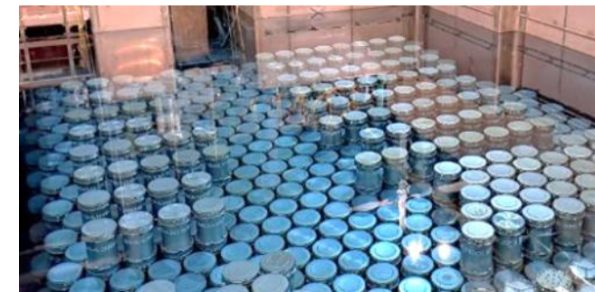
Organisation anticipée des curseurs de coques en vue de la mise en service de la cellule