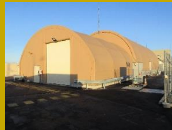
Bâtiment modulaire de conditionnement des déchets UNGG du Silo 130 en fûts ECE