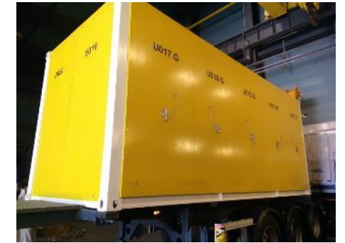
Citerne équipée de ses protections radiologiques, utilisée pour le transfert des effluents